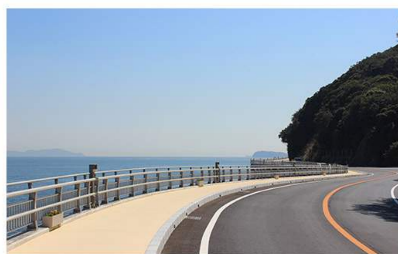
13 海岸沿い（洲本シーサイドスカイウォーク）を道なりに走ります。