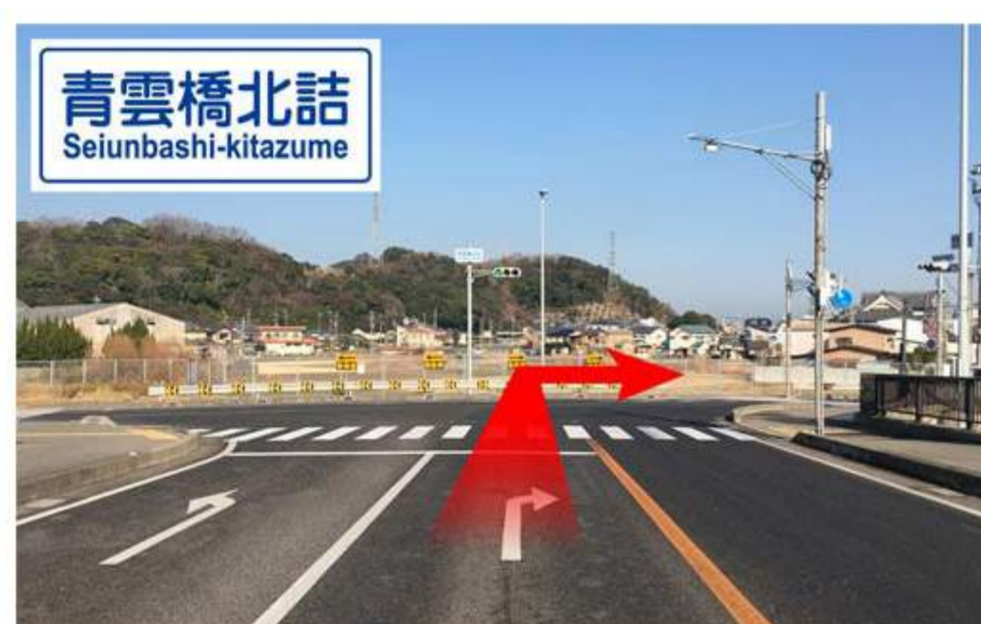
5 トンネルを抜けてしばらく走ると国道28号線のバイパスへ合流します。T字路に交わります。【青雲橋北詰】の交差点。ここで右折。