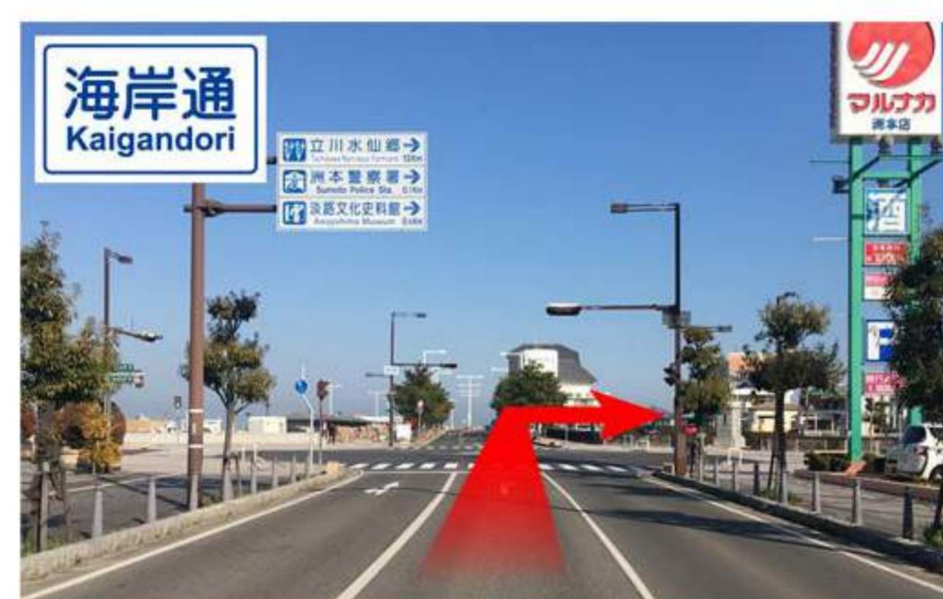
10 少し進むと右前方に【マルナカ】の看板が見え、【立川水仙郷・洲本警察署・淡路文化史料館】の看板が見えます。ホテルニューアワジグループの看板がある【海岸通】の交差点を右折。