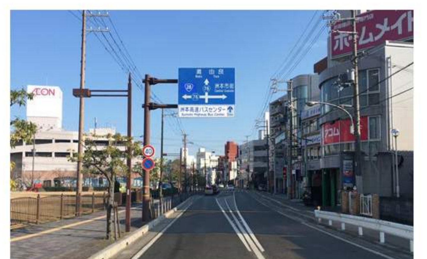
8 橋を渡り少し進むと左前方に【イオン】、右手には【アコム】が見えます。そのまま直進。【栄町2丁目】交差点も直進です。