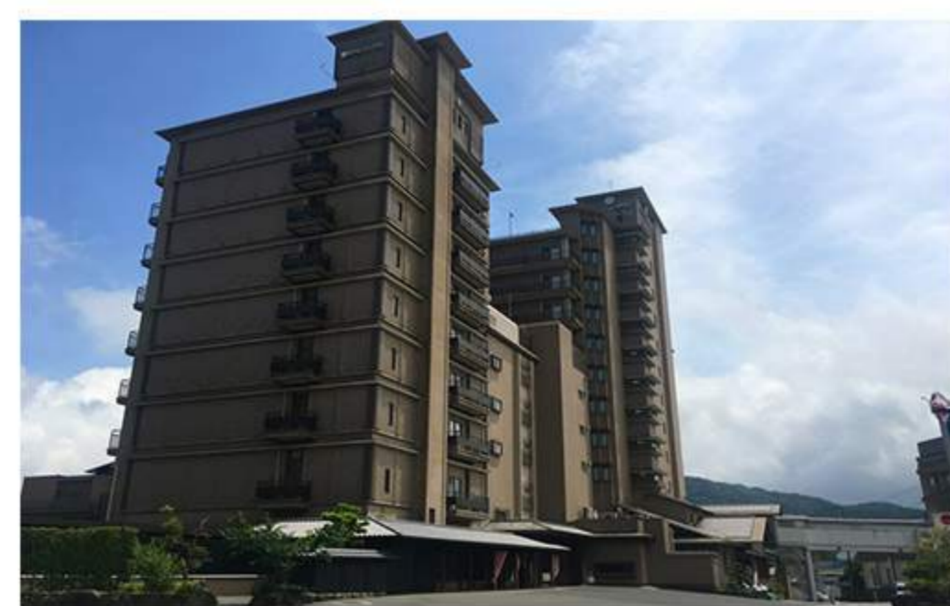
14 お疲れ様でした。道路左手にホテルニューアワジが、向かいには駐車場があります。200台分の駐車スペース（もちろん無料）を確保しておりますので、ご安心くださいませ。

国立公園 淡路島 洲本温泉 政府登録伝統的建造物群地区 日本観光地選奨 ホテルニューアワジ