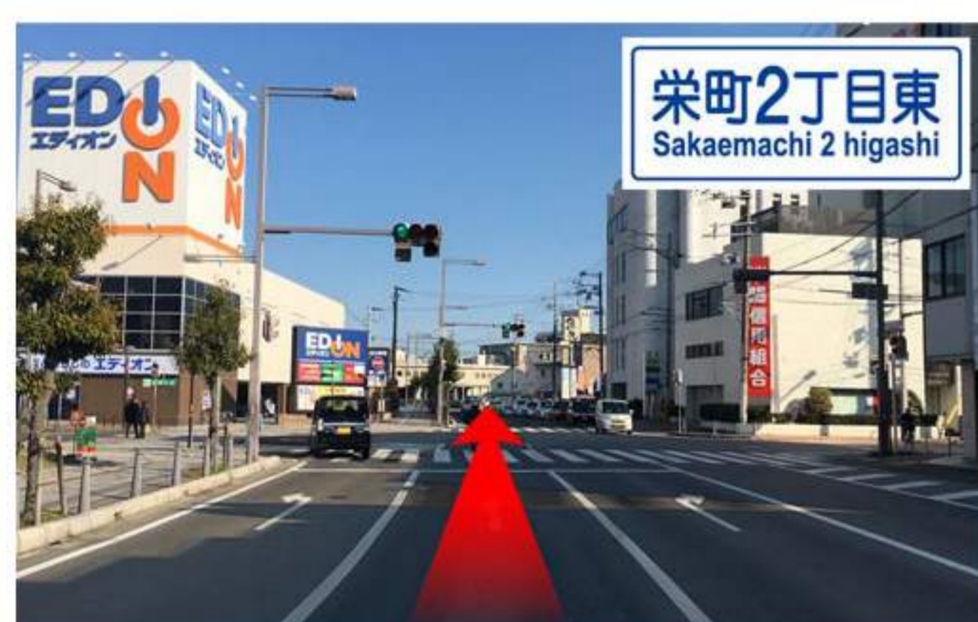
9 【イオン】を左手に見ながら直進。左前方には【エディオン】、右前方に【淡陽信用組合】があります。ここが【栄町2丁目東】の交差点。直進です。