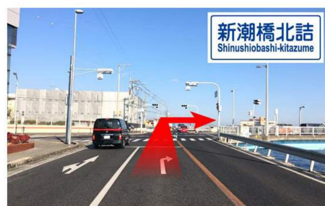
7 【新潮橋北詰】の交差点です。まず手前に【洲本警察署】の案内、その向こうに【新潮橋北詰】の案内があります。右折して橋を渡ります。