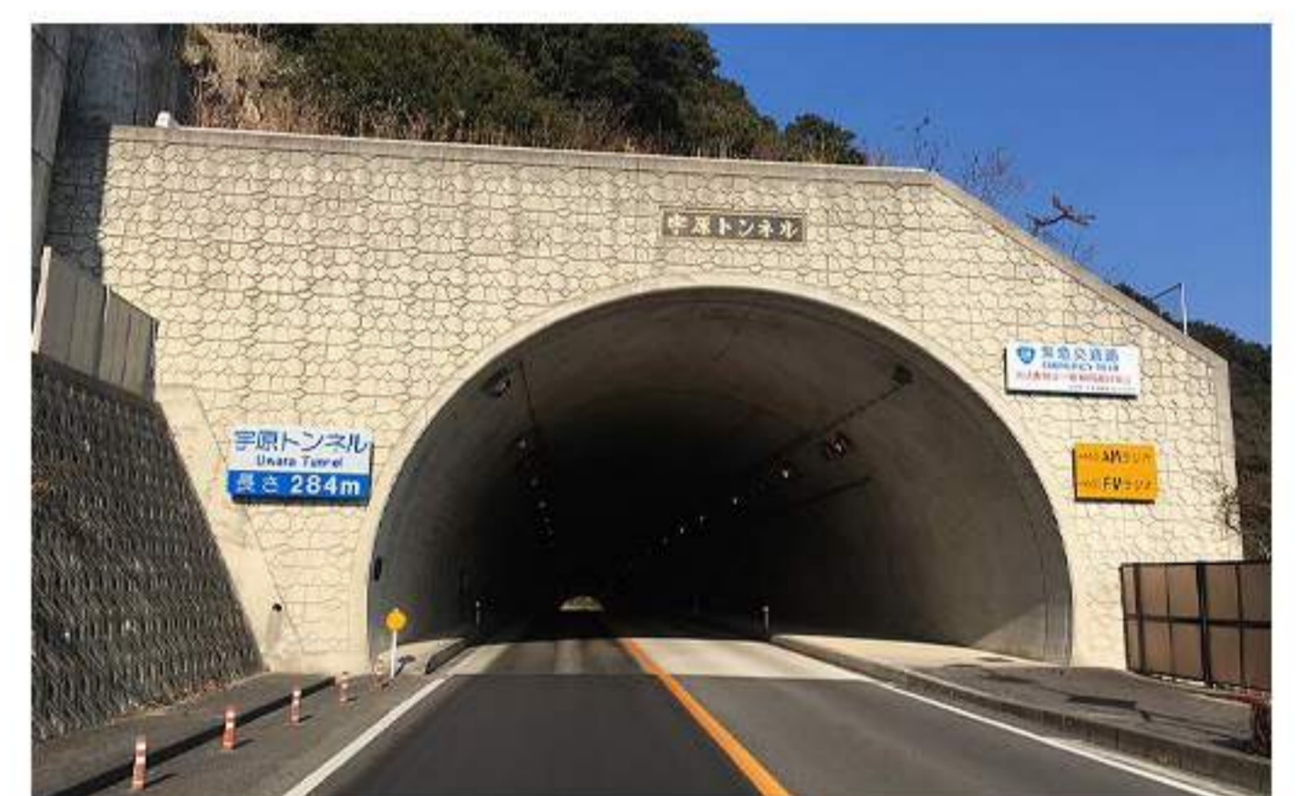
4 【宇原トンネル】を通ります。