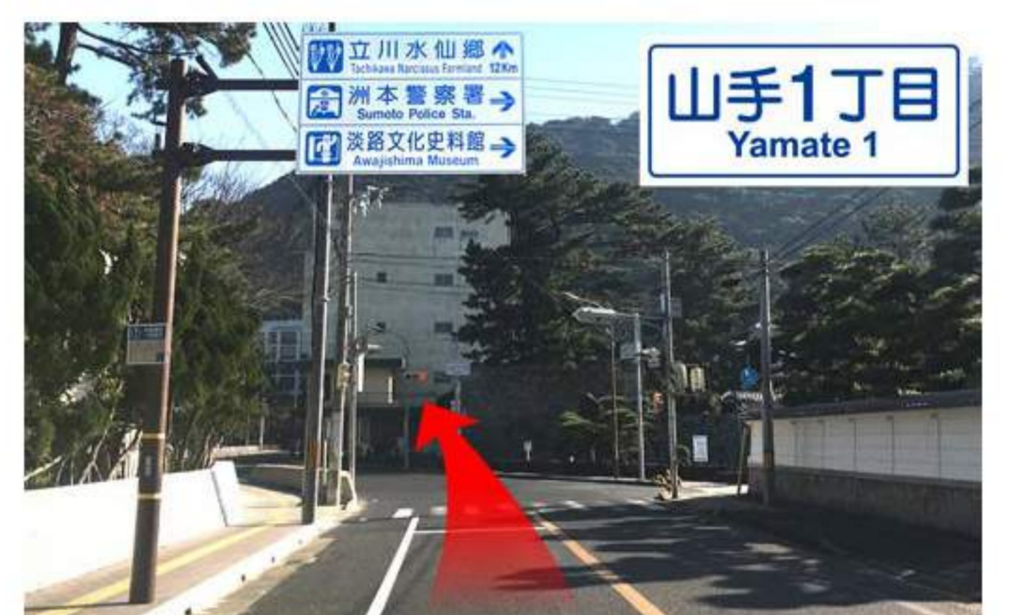
12 ここが最後の交差点【山手1丁目】です。左手には【大浜海岸】があります。海岸沿いに直進。