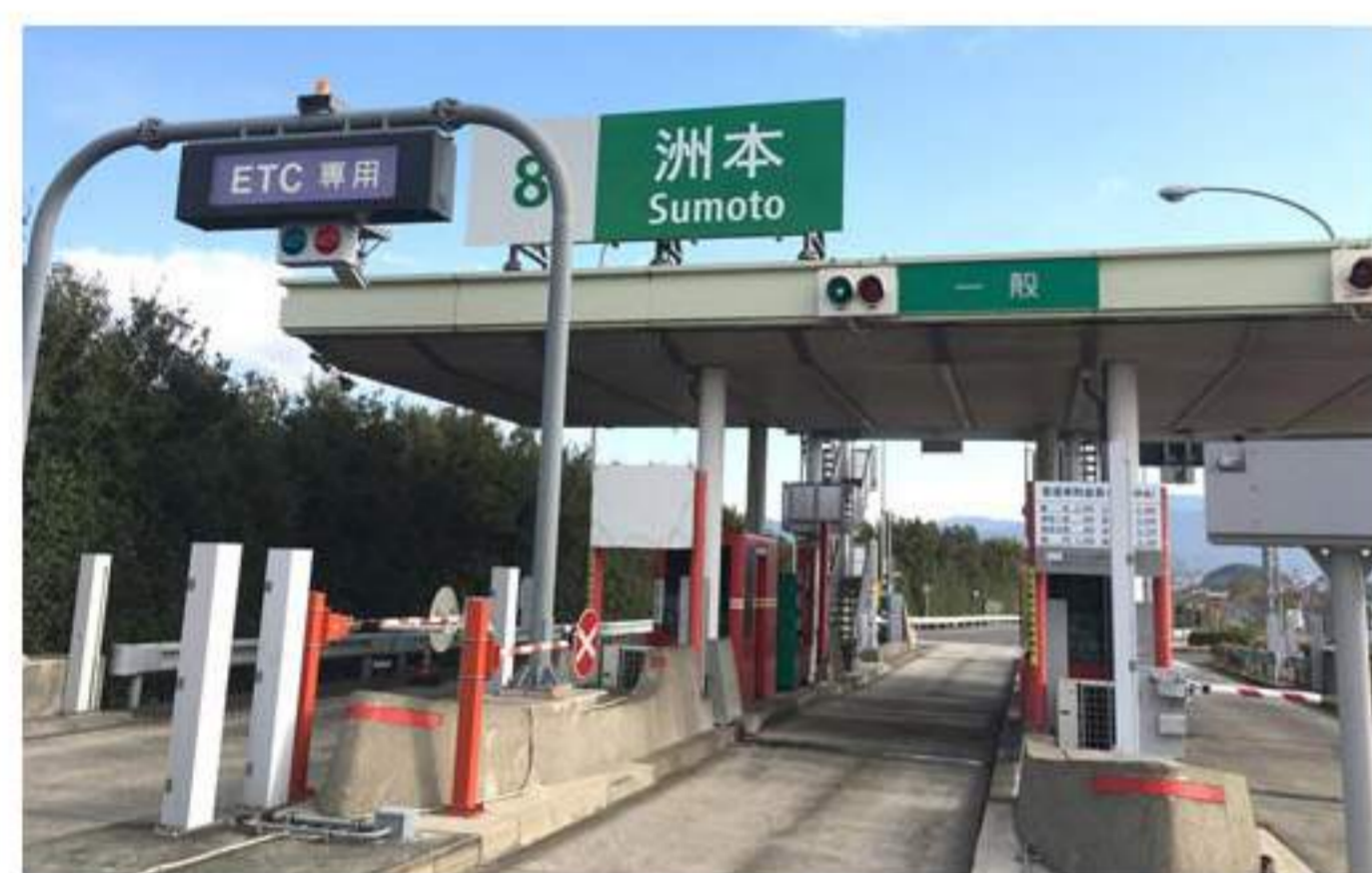
1 ここから約8kmの道順です。