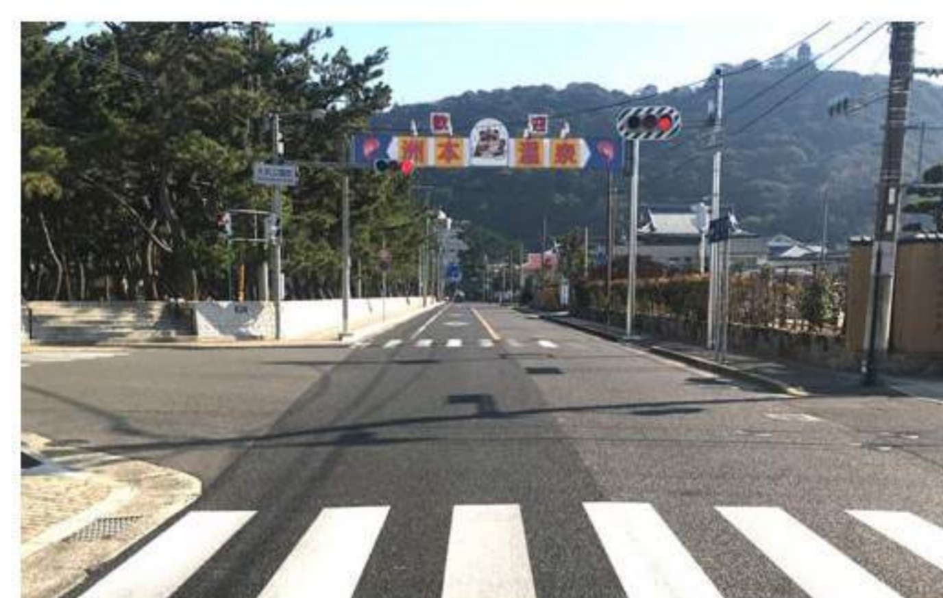
11 【洲本温泉】の歓迎看板も見えてきます。そのまま直進です。