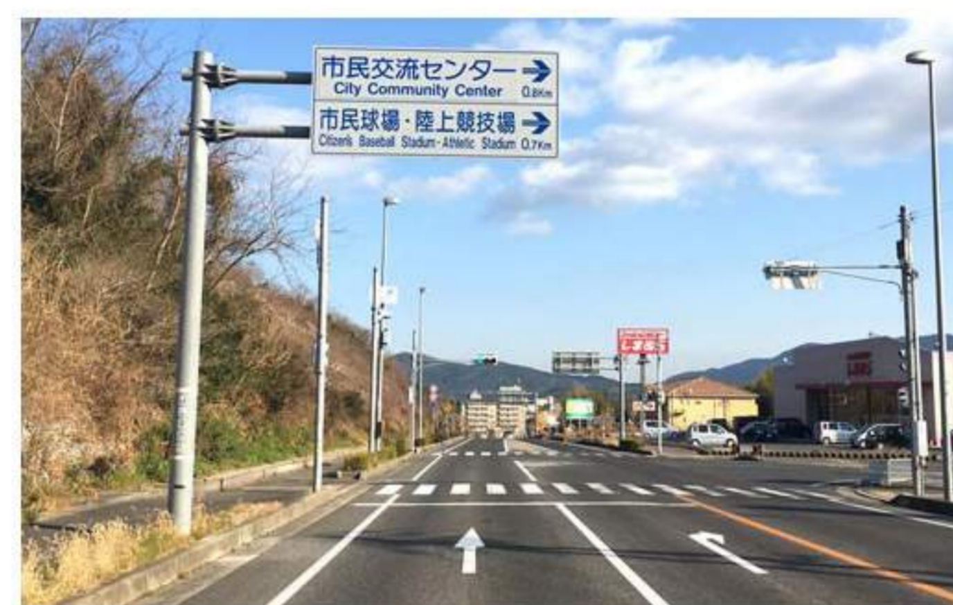
3 【市民交流センター】【市民球場・陸上競技場】の案内板が見えてきます。右前方には【しまむら】があります。直進です。