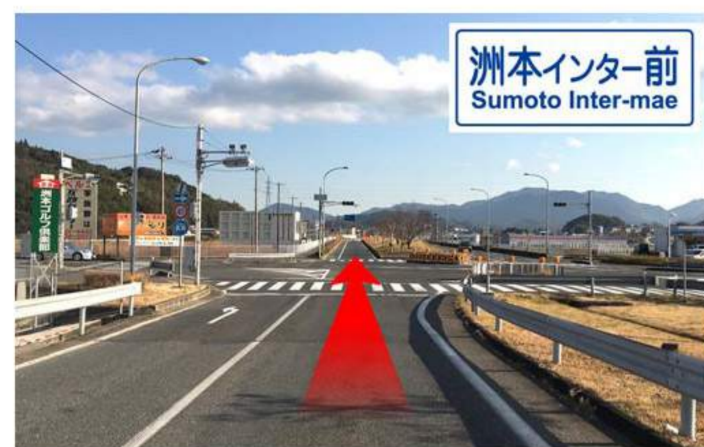
2 最初の交差点。直進です。