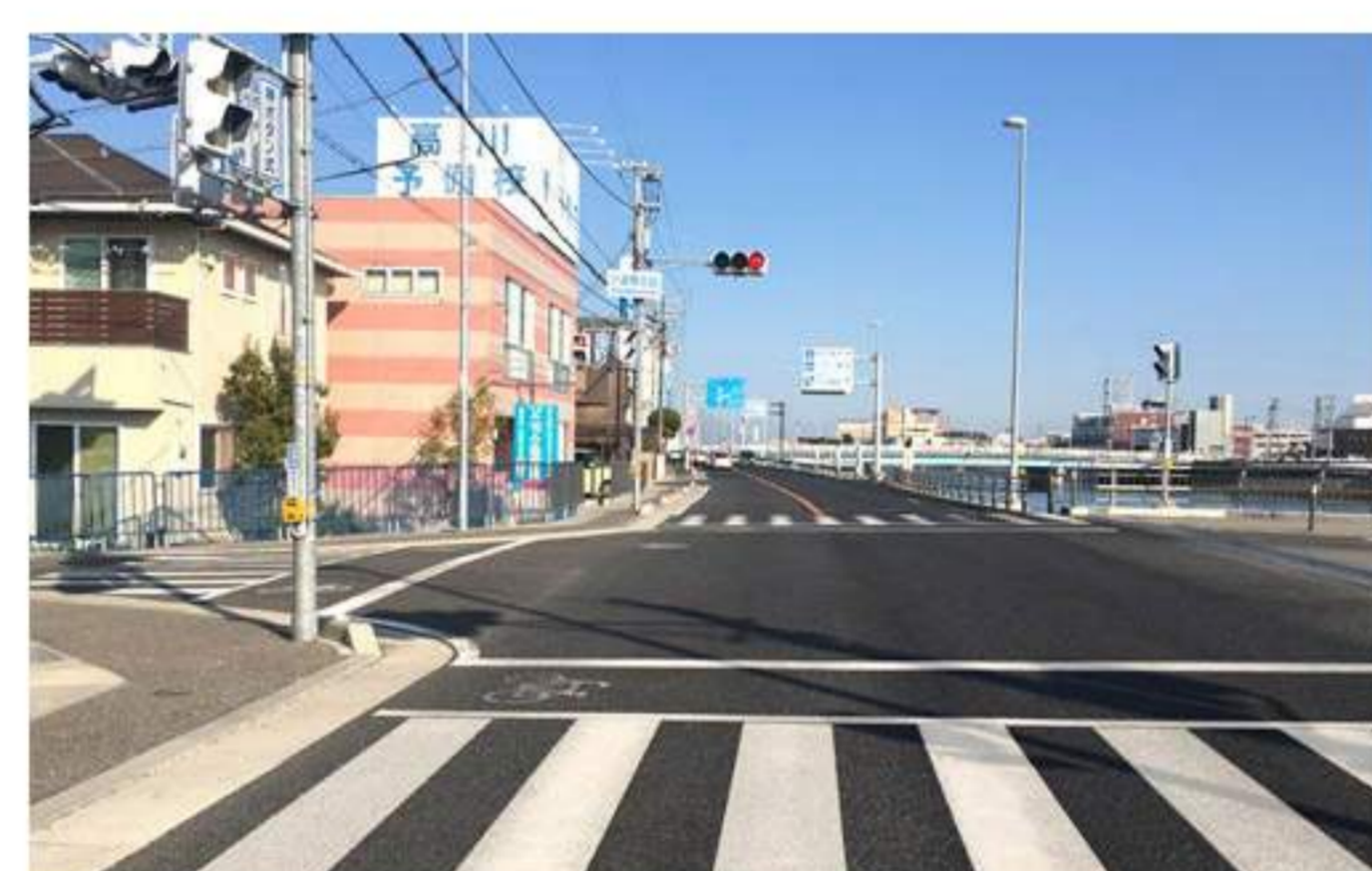
6 しばらくすると左手に【高川予備校】【ジブラルタ生命】【NTTDoCoMo】が立て続けにあります。これらを過ぎてすぐの信号が【新潮橋北詰】の交差点です。