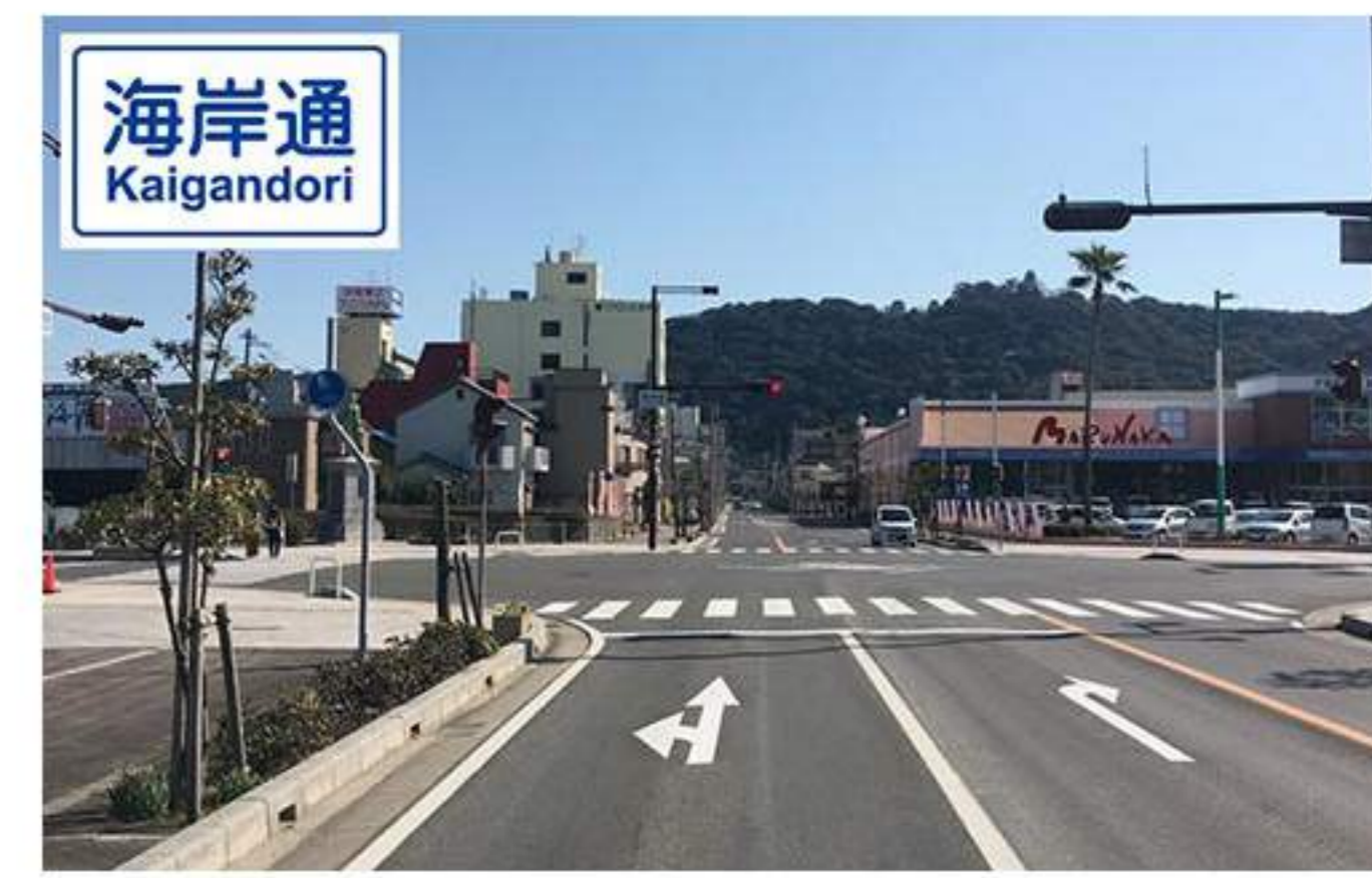
8 【洲浜橋】を渡って2つ目の信号【海岸通】の交差点。右前方には【マルナカ】があります。直進です。