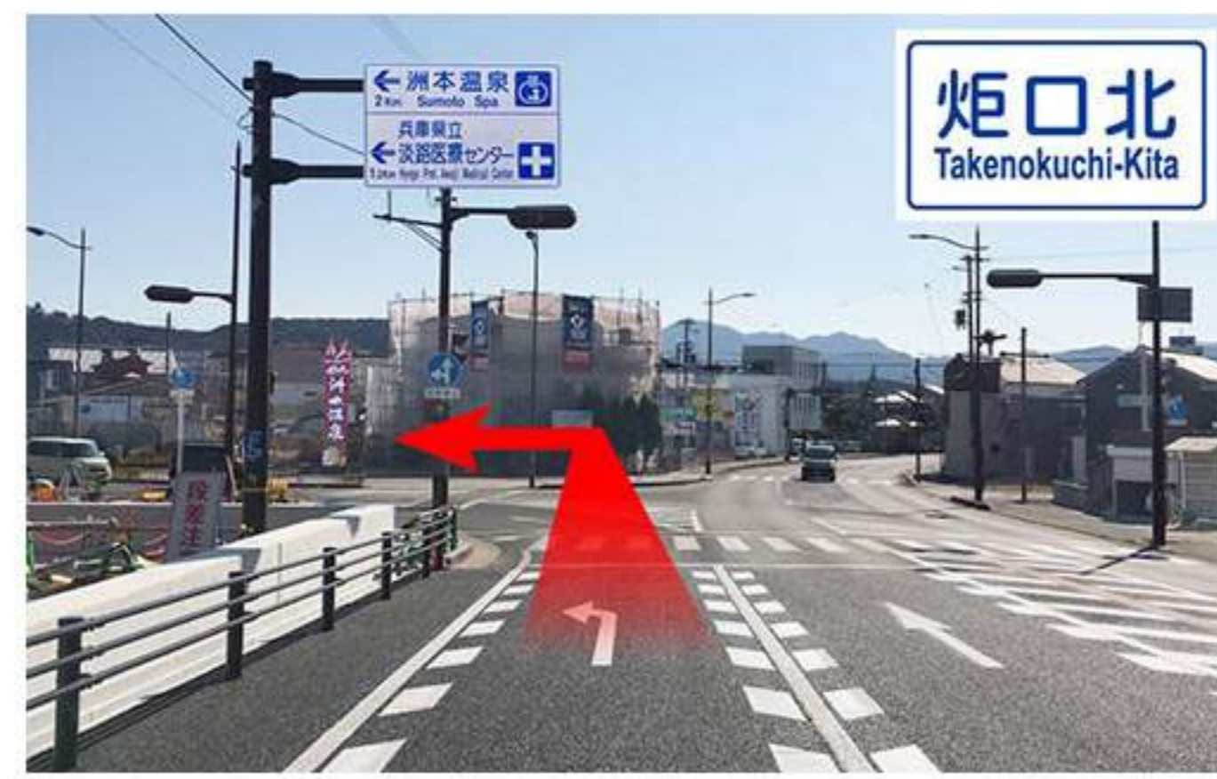
7 ここが【炬口北】の交差点です。【洲本温泉】、【兵庫県立淡路医療センター】の案内板もあり、ここを左折します。