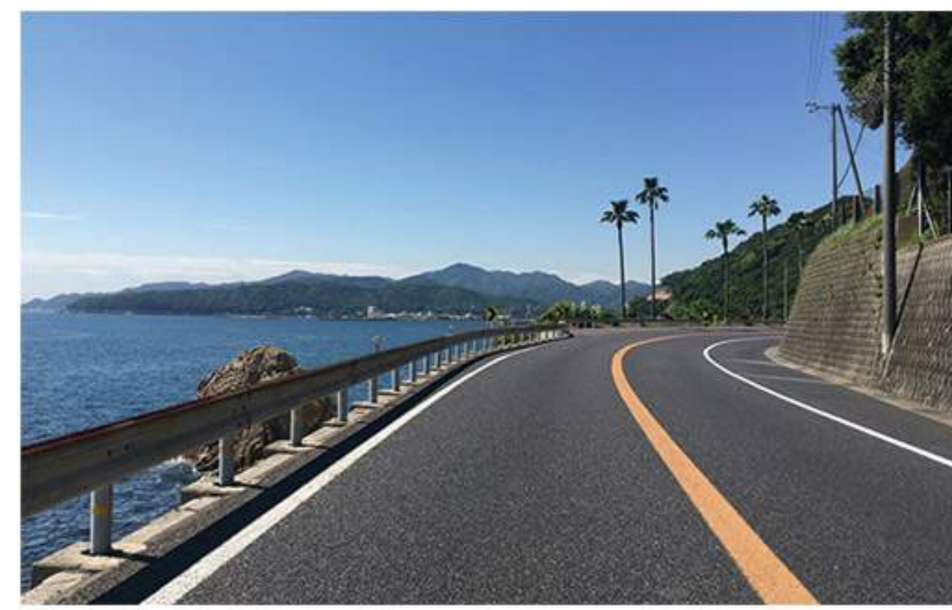
6 美しい海の風景が続く海沿いの道を約9.5km、【炬口北】の交差点まで進みます。