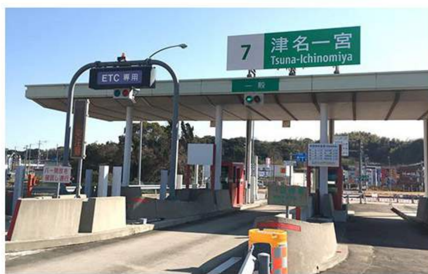
1 ここから約16kmの道順です。