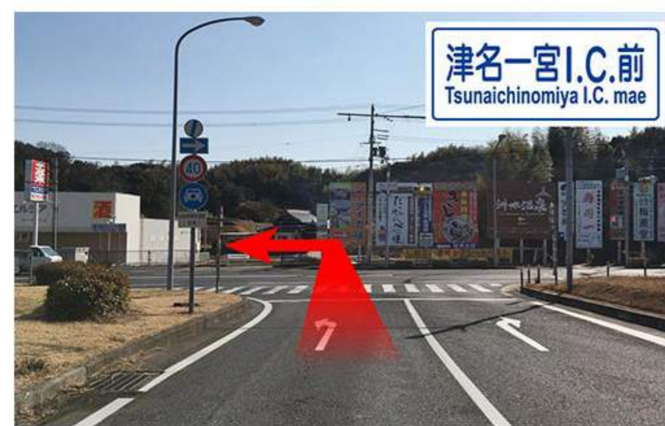
2 津名一宮ICを降りてすぐのT字路。左前方に【ウエルシア】があり、ここを左折。