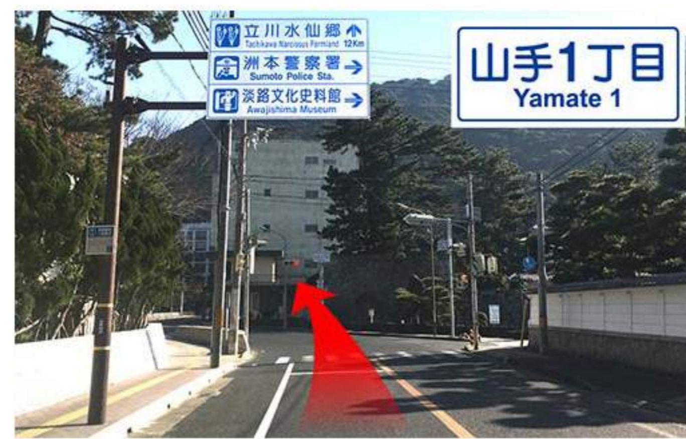
10 ここが最後の交差点【山手1丁目】です。左手には【大浜海岸】があります。海岸沿いに直進。