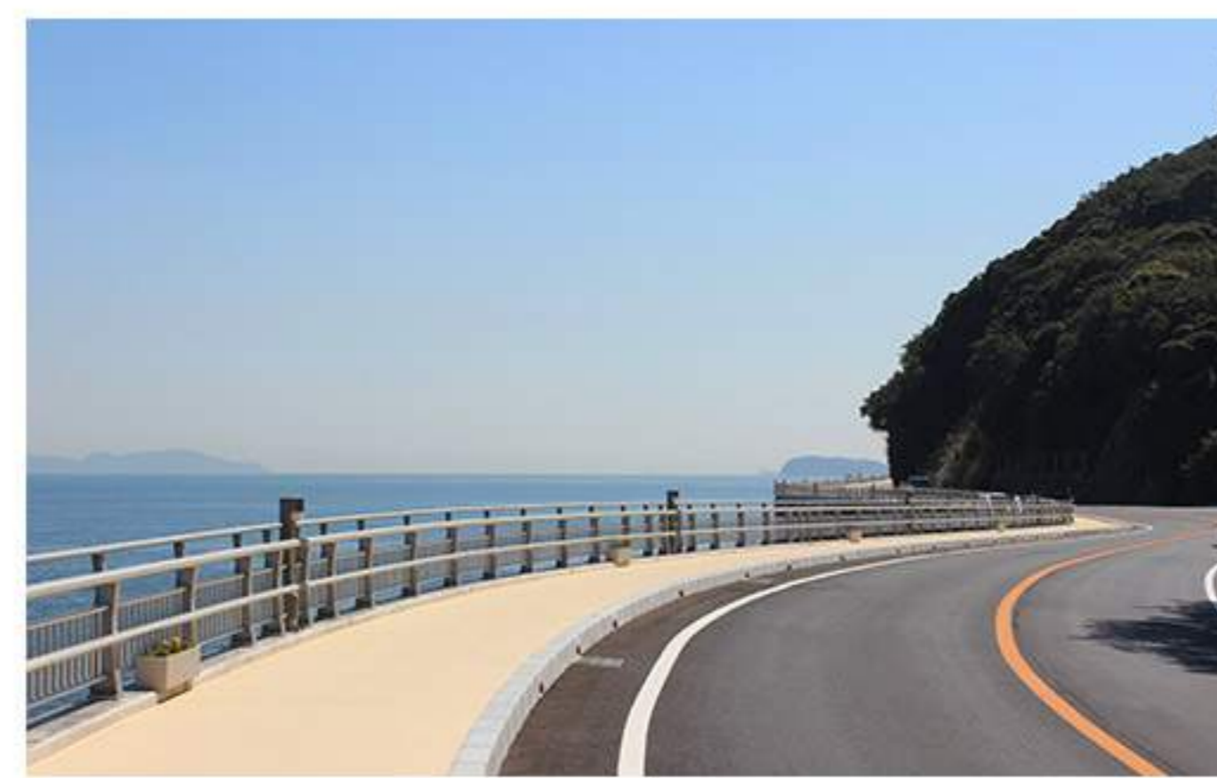
11 海岸沿い（洲本シーサイドスカイウォーク）を道なりに走ります。