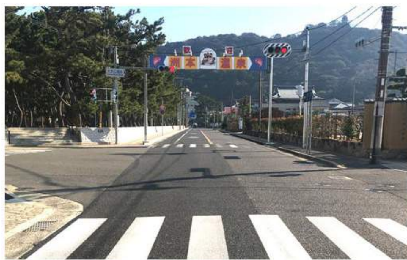
9 【洲本温泉】の歓迎看板も見えてきます。そのまま直進です。