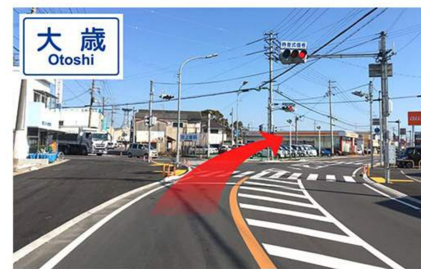
4 少し進むと【大歳】の交差点があります。【au】、【トヨタカローラ】が見える右前方に進みます。