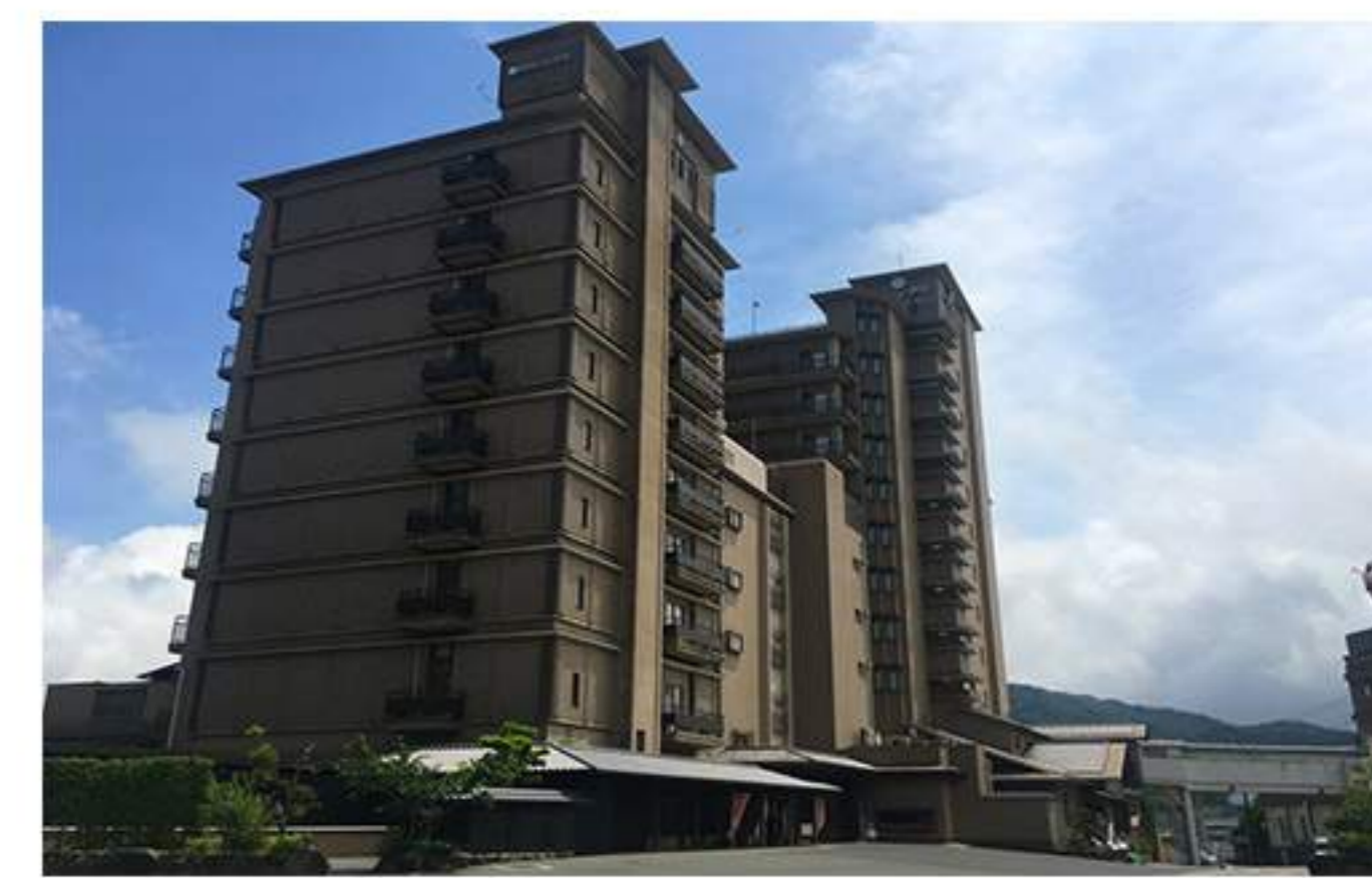
12 お疲れ様でございました。道路左手にホテルニューアワジが、向かいには駐車場があります。200台分の駐車スペース（もちろん無料）を確保しておりますので、ご安心くださいませ。